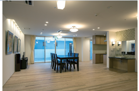
< 生活共同スペース >