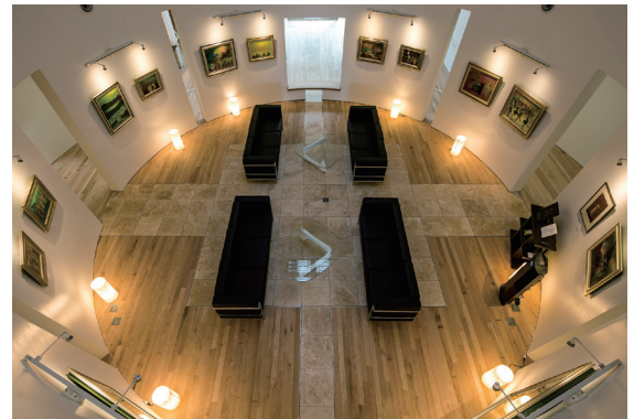
< 地域交流スペース >