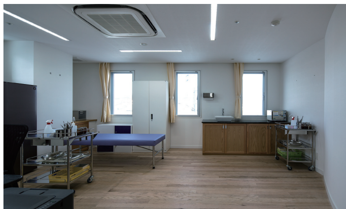
< 医務室 >