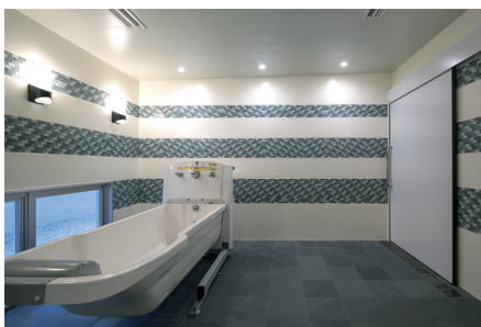
< 特殊浴槽 >