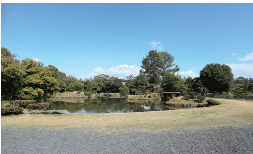
< 衆楽園 >